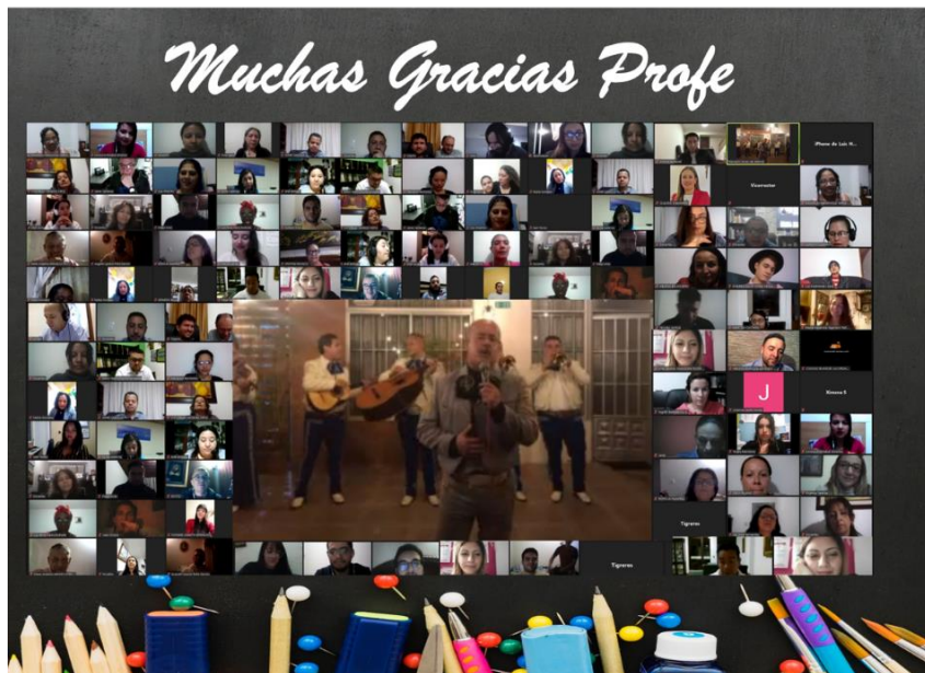
Con una serenata sorpresa se dio inicio a una celebración para los maestros.

En la semana del 11 al 15 de mayo, los maestros recibieron