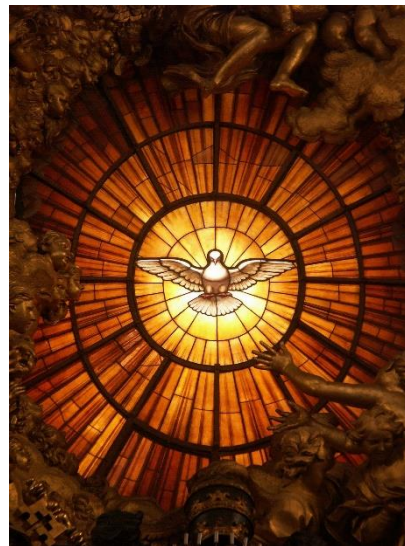
Pidamos al Espíritu Santo que nos llene de paz en estos tiempos.

Finalmente, como miembros de la Familia Dominicana reconozcamos en esta Pentecostés esa magnífica obra que hace el Espíritu Santo para con la Orden de Predicadores. Reflexiona hoy vísperas de Pentecostés, solemnidad en la cual la Iglesia invoca la Tercera Persona de la Santísima Trinidad con las siguientes preguntas: ¿Quién es el Espíritu Santo para ti? ¿Cómo se percibe la acción del Espíritu Santo en tu vida? Y, por último, ¿De qué manera has desarrollado y aprovechado los dones del Espíritu Santo en tu caminar hacia el horizonte de la vida, Dios?