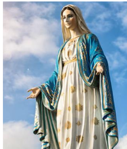
Durante el mes de mayo celebramos el mes de nuestra Madre: María.

En estos espacios se prioriza la fraternidad, la comunicación, la esperanza y la confianza de continuar con corazón firme buscando la misericordia de Dios y el calor maternal. A propósito, se enmarcaron diferentes temáticas, como por ejemplo, el mes dedicado también a las madres, el bienestar y cuidado de la