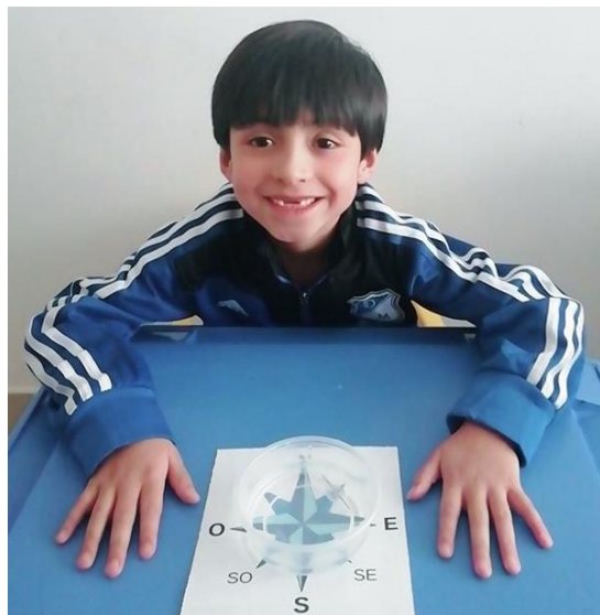
Nuestros estudiantes, entre otros, han aprendido a realizar brújulas caseras.

Más allá del compromiso firmado en un papel, nuestro compromiso es de corazón. Hacemos nuestro mayor esfuerzo para mejorar día a día y trabajamos para que nuestros estudiantes sean los mejores del país, no solo a nivel académico, sino social y espiritual.